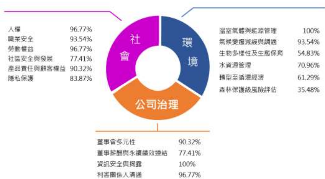
圖一：企業關注的永續發展目標對應環境、社會及公司治理之認知比例